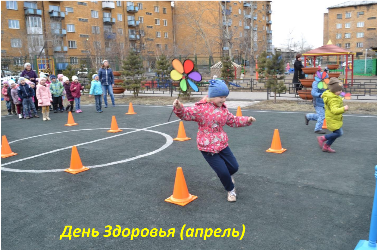
День Здоровья (апрель)